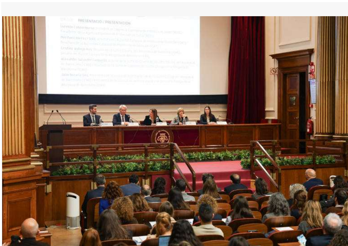
La APDCAT llama a garantizar los derechos fundamentales en el uso de datos personales

La Autoridad Catalana de Protección de Datos (APDCAT), la Agencia Española de Protección de Datos (AEPD) y el Ilustre Colegio de la Abogacía de Barcelona (ICAB) - a través de su Sección de Derecho Digital e Inteligencia Artificial- han reunido a más de veinte expertos en el ámbito de la IA y la protección de datos en la sede del ICAB con motivo de la celebración de los "Diálogos del Día de la Privacidad", con el