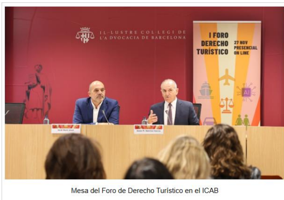
Mesa del Foro de Derecho Turístico en el ICAB

El I Foro de Derecho Turístico, organizado por ACAVE, UNAV y el ICAB, y celebrado ayer simultáneamente en Barcelona y Madrid, así como en formato 'on line', volvió a hacer hincapié en las implicaciones legales de la entrada en vigor del RD 933/2021 . Justamente ayer, mientras se celebraba el foro, el Ministerio del Interior anunció la próxima audiencia pública de la Orden Ministerial sobre el registro de viajeros que entrará en vigor el próximo lunes, 2 de diciembre.