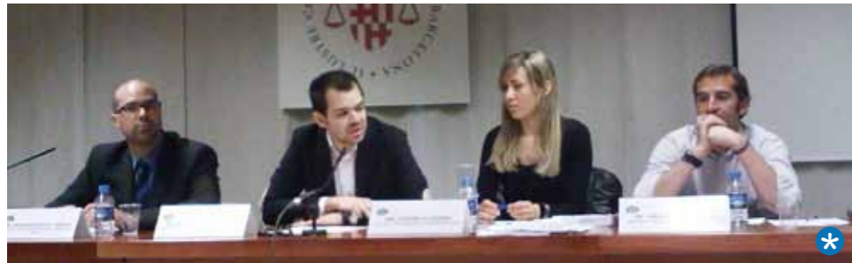
Assemblea Anual del GAJ

L'informe anual i el pressupost presentats a l'assemblea van ser aprovats per una molt àmplia majoria.