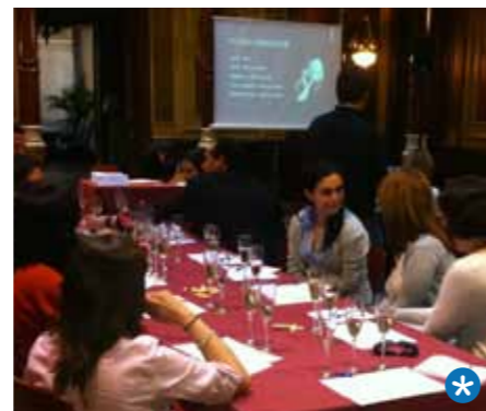
Cata de Cava al Pati de Columnes

Després d'una petita introducció sobre la producció del cava, les diferències entre les diverses classes, com s'ha de servir, la diferència amb el "champagne", i l'elaboració del cava rosat, es procedí a la cata de sis caves diferents per poder analitzar la diferència entre cada classe. Un magnífic exercici per aprendre a valorar i beure aquest producte de la terra que ben segur és repetirà.