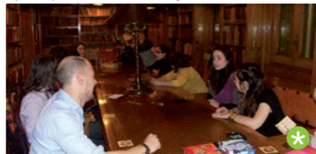
Biblioteca del Misteri.

Posteriorment, el 13 de juny es va fer una segona edició de la biblioteca del misteri. No obstant, es va aprofitar el bon temps per sortir a la terrassa de l'ICAB i els jocs van tenir un caire més participatiu. Les estrelles de la tarda van ser The Boss i el clàssic Cash'n'Guns. En el primer cadascú ha d'aconseguir dominar el major nombre de ciutats, ja sigui Cincinnati, Chicago o New York. En el segon joc, armats amb pistoles de goma-escuma, uns lladres s'han de repartir el botí d'un robatori. Tant en un com l'altre els objectius només es poden aconseguir d'una manera: creant aliances. La negociació i la capacitat de deducció són les millors armes de les que disposem; però trencar una confiança o actuar d'una forma imprudent eren motius per penalitzar al jugador. El temps va passar volant i tots aguaiten per tornar a participar... Beware of Friday the 13th. Alba Tàsies