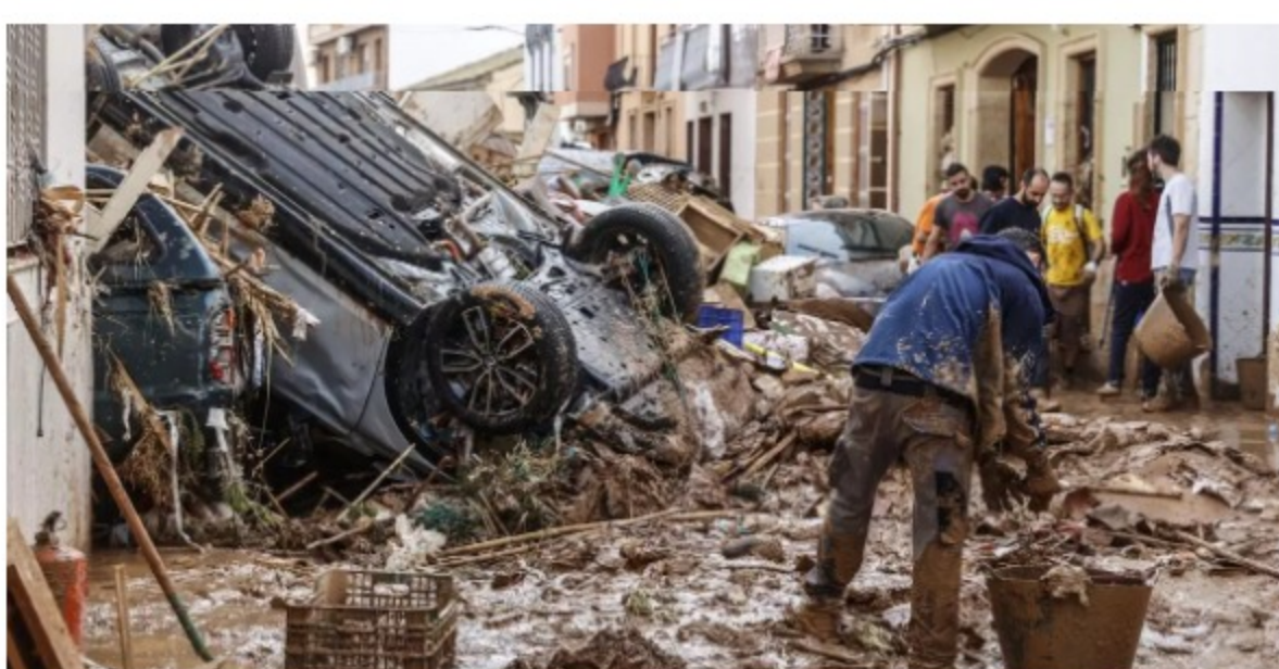
Varias personas limpian los estragos ocasionados por la DANA, a 1 de noviembre de 2024, en Paiporta, Valencia, Comunidad Valenciana (España). El sexto balance de fallecidos por el paso de la DANA por la provincia de Valencia deja 202 víctimas mortales.

Las recientes tragedias, como la DANA en Valencia , nos recuerdan una dolorosa realidad: cuando las crisis golpean, miles de personas, empresarios, autónomos y familias enteras quedan sin protección adecuada en sus contratos . La ciudadanía necesita soluciones rápidas, justas y eficaces , que no dependan de largos y costosos procesos judiciales.