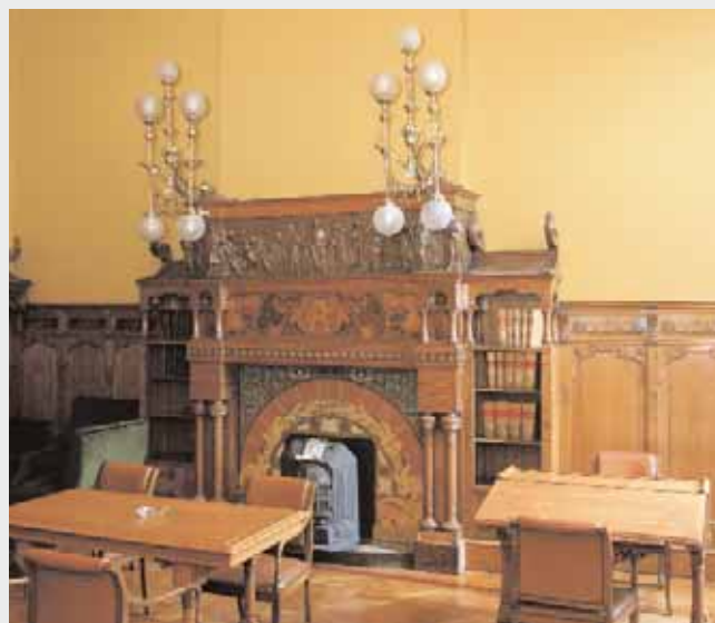
Mobles dissenyats per Lluís Domènech i Montaner

La construcció del Palau de Justícia, a la qual hi va contribuir el Col·legi, representa, més enllà d'una infraestructura capdavantera en el seu temps, un símbol i garantia de defensa dels ciutadans.