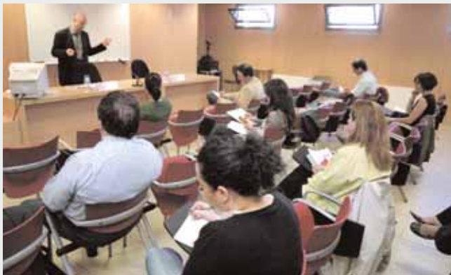
Curs Bàsic de Dret laboral organitzat per la Comissió de Cultura

Alhora, afegeix que la pràctica empresarial d'indicar una causa d'acomiadament que no es correspon amb el motiu real de la decisió de donar per acabat el contracte de treball (l'anomenat acomiadament fraudulent) no justifica per si mateixa la qualificació de nul·litat. L'argument es troba a l'article 108.2 de la Llei de Procediment Laboral de 1990, que enuncia de manera tancada els casos en què l'acomiadament ha de ser qualificat com a nul entre els quals no es troba l'extinció per voluntat de l'empresari el motiu vertader del qual no coincideixi amb la causa formal expressada en la comunicació del cessament.