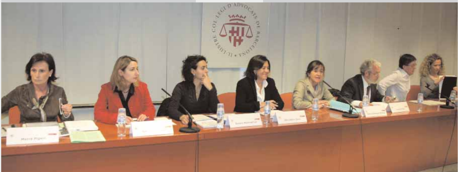
Jornada organitzada per la CRAJ, on es va convidar als representants dels diferents partits polítics.

Recordeu que a la pàgina web del Col·legi trobareu tots els serveis i tràmits que fa la CRAJ.