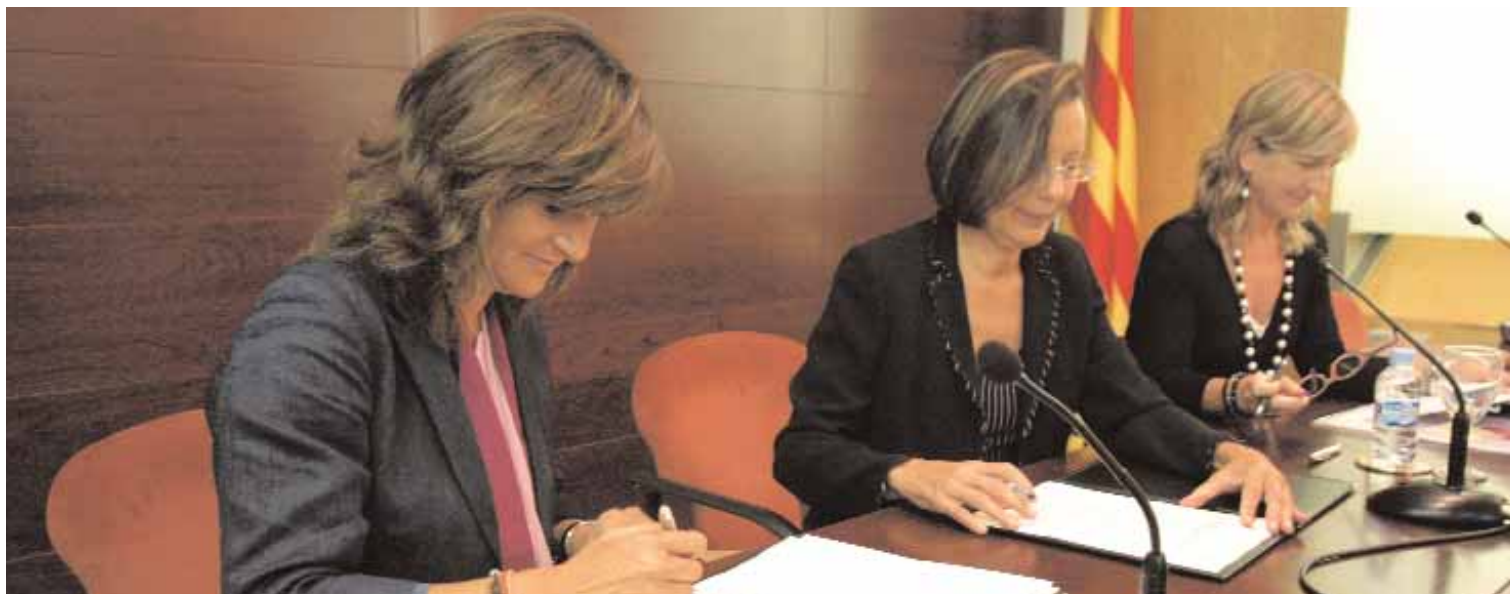
La consellera de Justícia, Montserrat Tura, va signar el 10 de setembre, els acords amb la presidenta del Consell dels Col·legis d'Advocats de Catalunya (CICAC), Sílvia Giménez-Salinas, i amb la presidenta del Consell dels Col·legis de Procuradors dels Tribunals de Catalunya, Anna Molerés, per a l'establiment dels marcs d'actuació que han de regir la prestació d'assistència jurídica gratuïta.