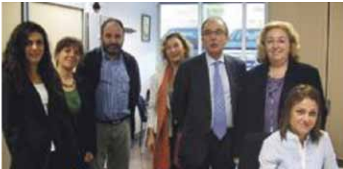
Vilafranca del Penedès