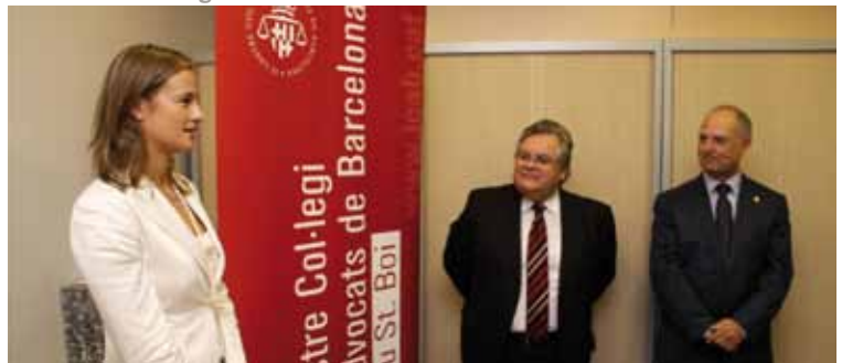
Sant Boi de Llobregat