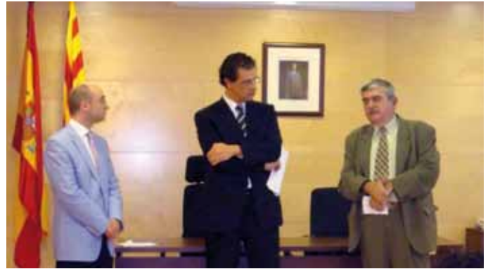
El Prat del Llobregat