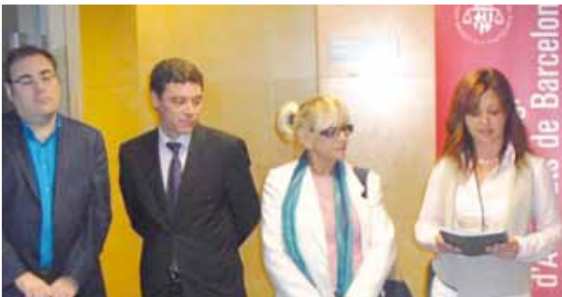
Santa Coloma de Gramenet