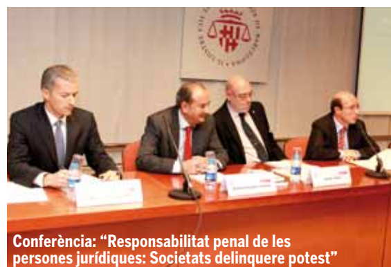
Conferència: "Responsabilitat penal de les persones jurídiques: Societats delinquere potest"