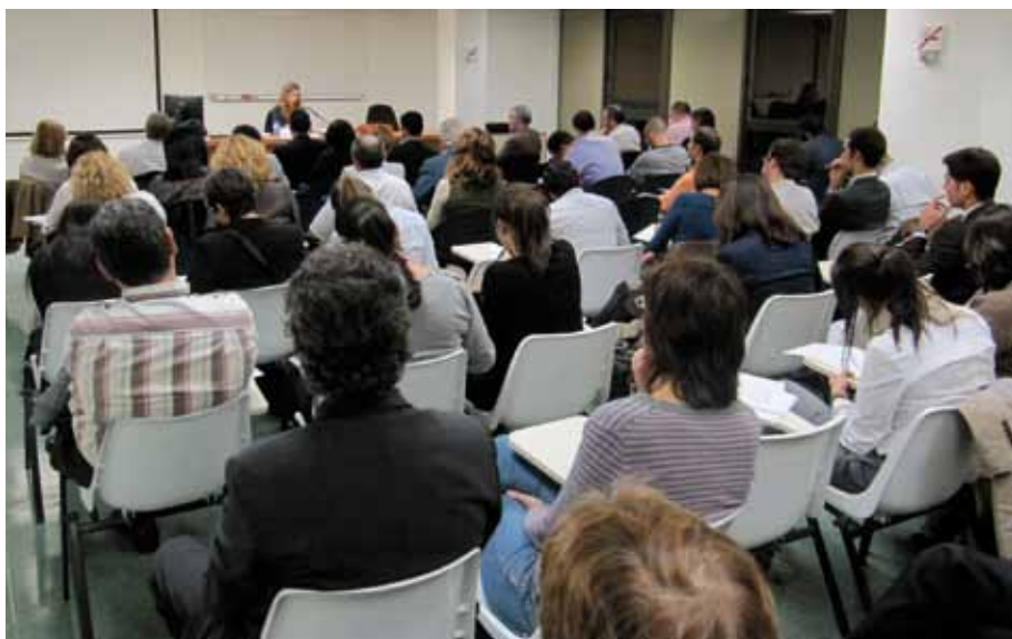
Dijous Administratiu: 'Les reformes de la Llei Òmnibus en la regulació del procediment administratiu: canvi de paradigma'. La ponència va tenir lloc a l'ICAB el passat 14 d'octubre.

Finalment, es preveu que la inexactitud, falsedat o omisió, de caràcter essencial, de qualsevol dada, manifestació o document que s'acompanyi o s'incorpori a la comunicació prèvia determinen la impossibilitat de continuar amb l'exercici del dret o de l'activitat afectada, sens perjudici de les responsabilitats penals, civils o administratives a que puguin donar lloc aquests supòsits.