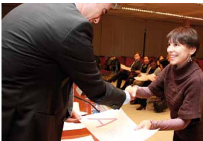
21 de gener: Entrega de Diplomes de la VIIa edició cAmpus ICAB (promoció 2009-2010)