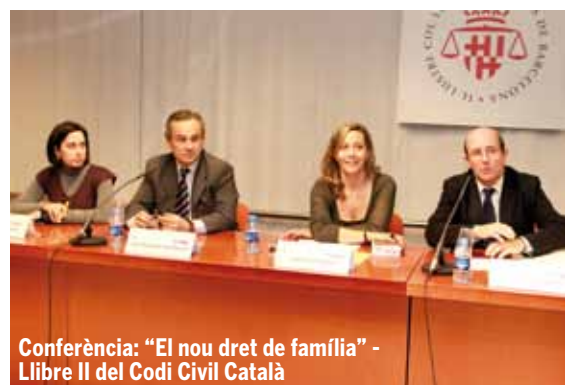
Conferència: "El nou dret de família" - Llibre II del Codi Civil Català

La principal novetat del Sant Raimon de Penyafort 2011 ha estat la celebració de la Primera Fira de l'Advocacia europea i de l'Arc Mediterrani els dies 2,3 i 4 de febrer de la qual us n'hem informat àmpliament en aquest mateix número.