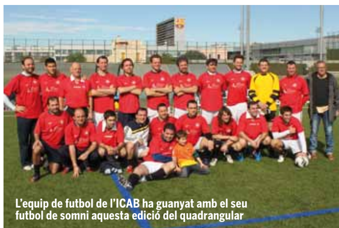
L'equip de futbol de l'ICAB ha guanyat amb el seu futbol de somni aquesta edició del quadrangular

nals. Les semifinals i final van ser molt disputades, quedant la classificació final de la següent manera: