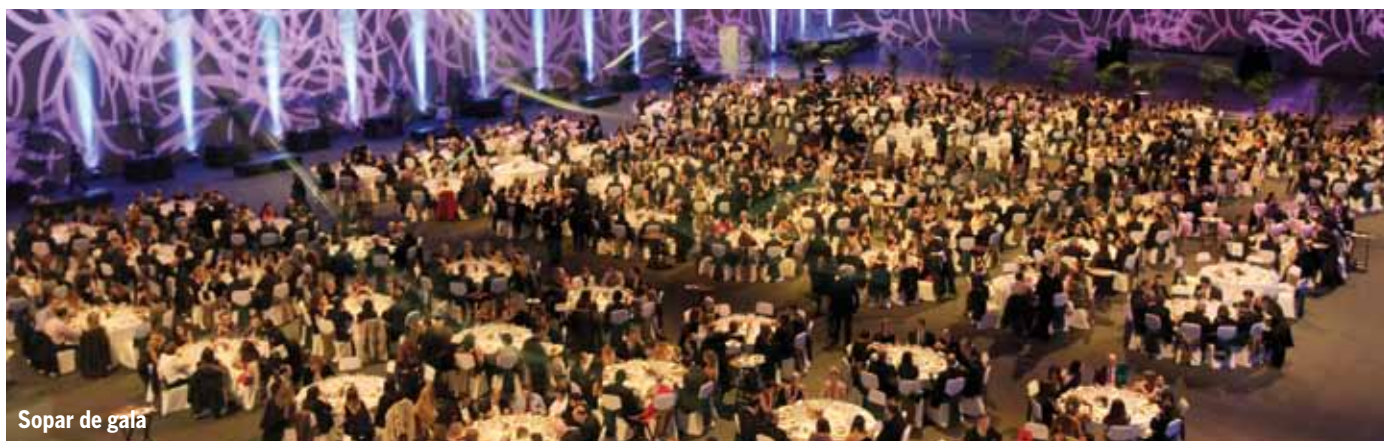
Sopar de gala