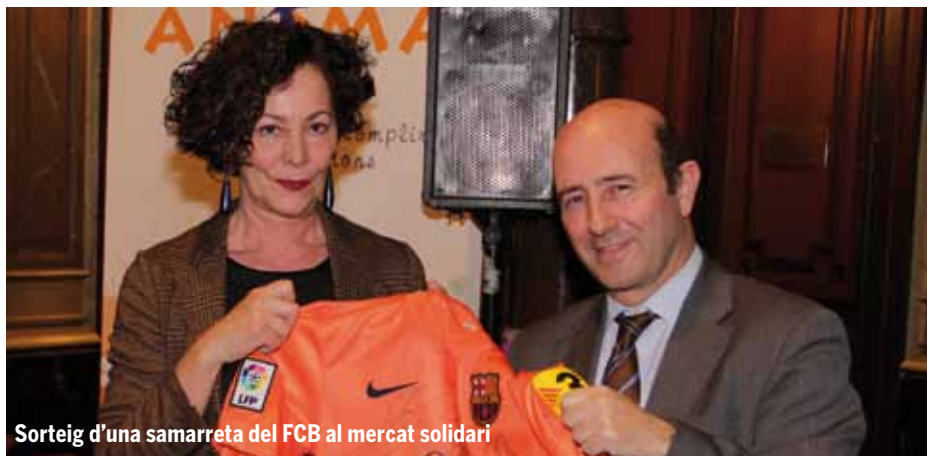
Sorteig d'una samarreta del FCB al mercat solidari

Per aquells que van preferir fer un donatiu, hi havia les guardioles per col·laborar amb Càritas i amb l'Associació Marc Palmés-Nens de Kàtana. A aquesta jornada cal sumar-hi, la recollida d'aliments que es va fer, un any més, en col·laboració amb la Fundació Banc dels Aliments de Barcelona i la destinació de part dels diners del tiquet del sopar de gala a la Fundació Degà Ignasi de Gispert, que ajuda als advocats que es troben en una situació desfavorida.