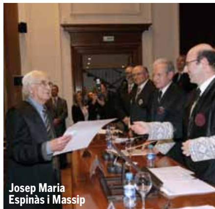
Josep Maria Espinàs i Massip