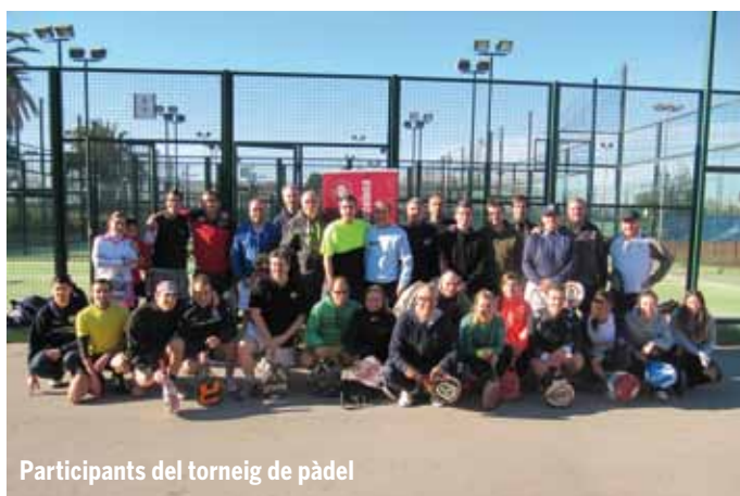
Participants del torneig de pàdel