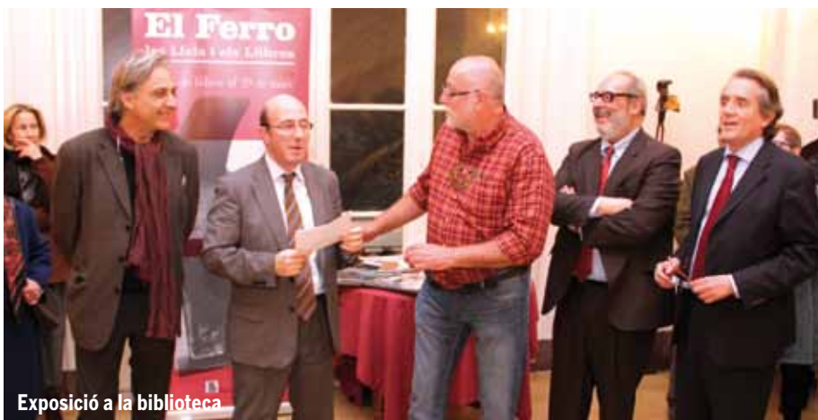
Exposició a la biblioteca

32 advocats van participar en el tradicional torneig de pàdel. Després d'una intensa fase de grups amb partits de 30 minuts de durada, la millor parella classificada de cada grup va accedir a les semifinals.