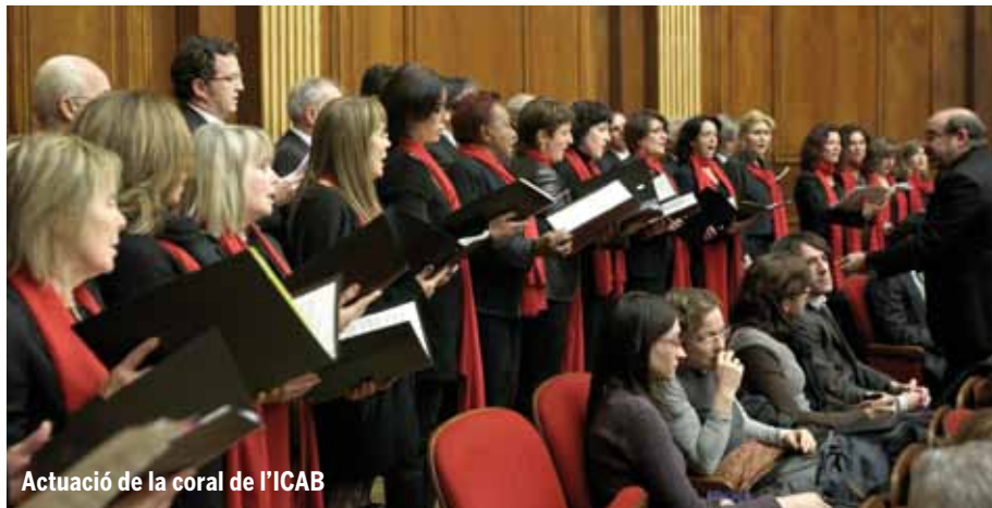
Actuació de la coral de l'ICAB

La coral va participar en molts dels actes commemoratius del patró dels advocats. Des de la Missa i Cerimònia civil a les sessions d'homenatge dels 25 i 50 anys. Però sense dubte el seu acte central va ser el concert que van oferir a la sala d'actes del Col·legi, el 13 de febrer.