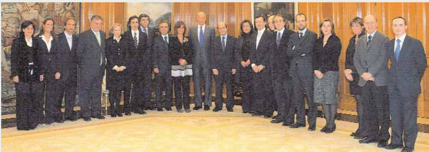
Recepció del Rei, el 3 de desembre, amb motiu del 175è aniversari de l'ICAB.