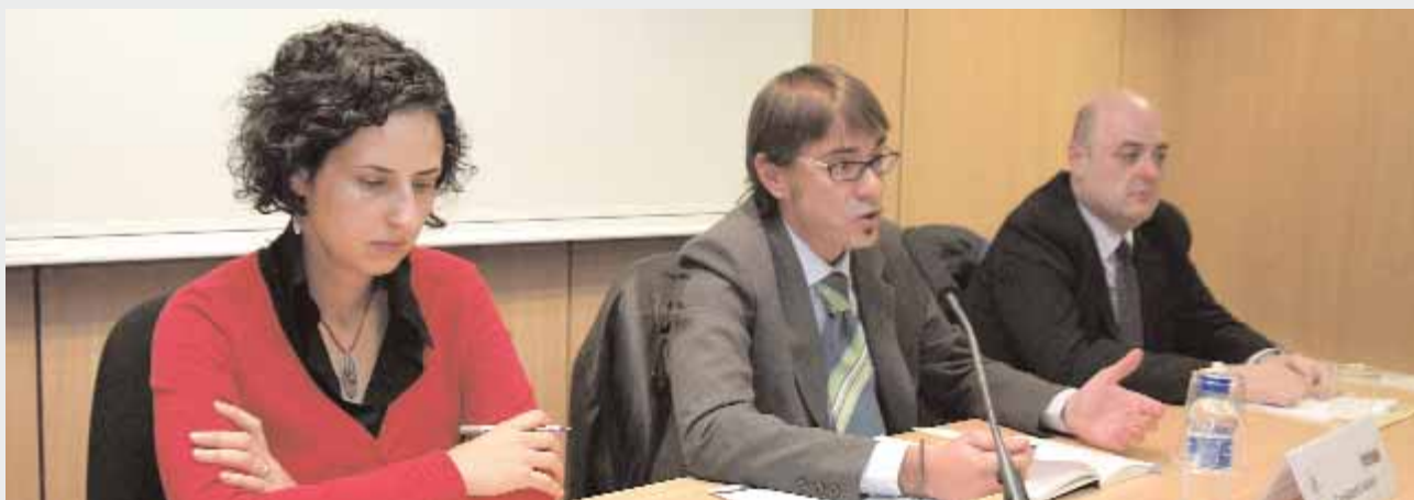
Sessions informatives sobre TO i Assistència Jurídica Gratuïta. Per advocats que s'incorporen al Torn d'ofici, 26 de novembre.