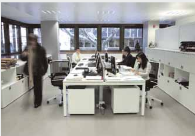
Nova ubicació de la Comissió d'Honoraris, a la primera planta de la seu col·legial.

L'esmentada resolució, en essència i tal com ha reproduït algun mitjà de comunicació, recolza la plena llibertat a l'hora d'establir els honoraris per part d'advocat/client, inclòs el pacte de quota litis, i reitera la submissió de la nostra professió al règim de lliure competència.