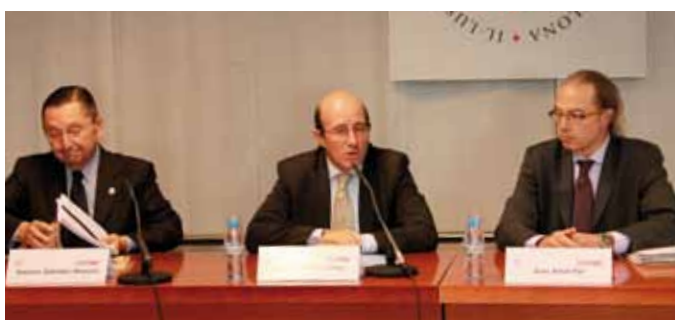
25 i 26 de novembre: II Congrés sobre Prevenció i Repressió del Blanqueig de Diners, organitzat per la Comissió de Cultura i CGAE.