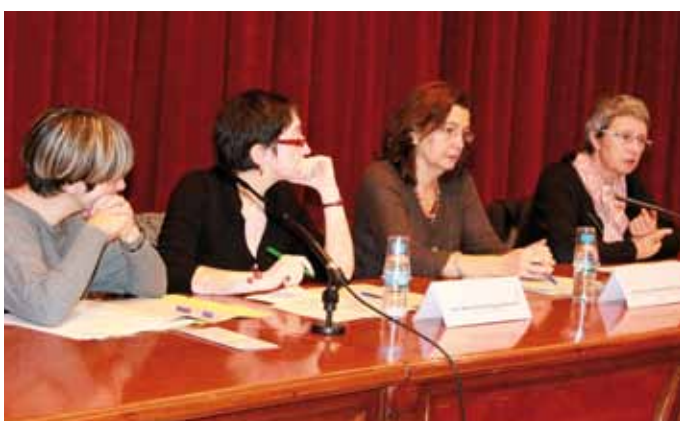
18 de novembre: III Jornades "Interferència parental (SAP): Només una forma de violència contra els i les menors?", organitzada per la Comissió de Dones Advocades amb la col·laboració de Dones Juristes