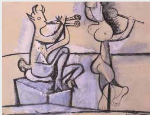
Pablo Picasso Faune musicien et danseuse (M.P. 1338) 1945 Lápiz y gouache sobre papel Musée Picasso Paris