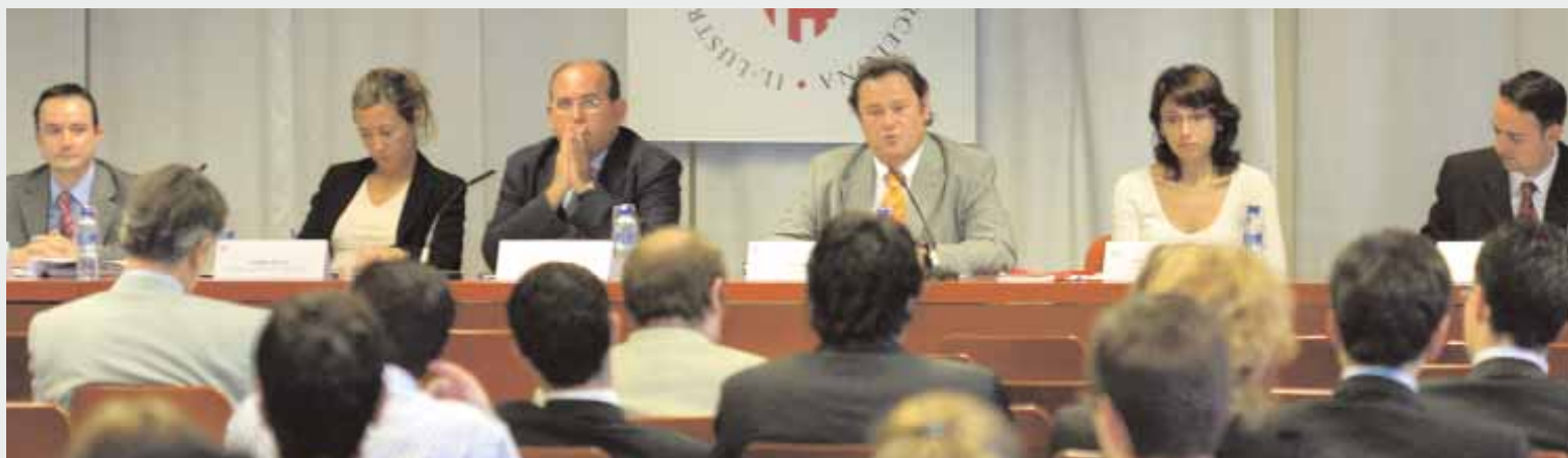
Una de les Sessions d'Orientació Professional (SOP) que l'ICAB, periòdicament, organitza per als advocats que s'incorporen al Col·legi.

En relació amb el segon dels requisits exigits, és a dir, l'acreditació de la capacitat personal , la Llei d'Accés a la Professions d'Advocat estableix que haurà de realitzar-se, per una part mitjançant cursos de formació amb les corresponents pràctiques externes; i d'altra banda i com a culminació al procés de capacitat professional , la corresponent avaluació de l'aptitud professional.